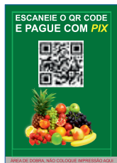
Página 01 Impressão