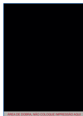
Página 02 Máscara de Tinta Branca